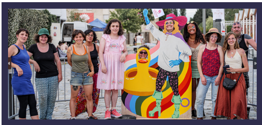
MARCHE DES FIERTÉS 2023

Il y en a pour tous les goûts ! En tant que bénévoles, vous pouvez bien évidemment participer à ces événements. Mais il est aussi possible de prendre part à l'organisation de ceux-ci !